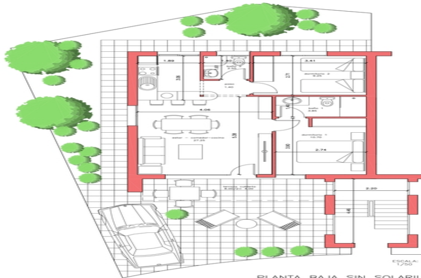
PLANTA BAJA SIN SOLARIUM VIVIENDA 054 SUP. PARCELA= 151,90 M2.