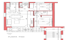
VIVIENDA MODELO "CADIZ" piso de 2 Dormitorios

SUP. UTIL : 59,00 M2. SUP. CONSTRUIDA: 70,00 M2.