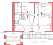
VIVIENDA TIPO ALMERIA piso de 2 Dormitorios