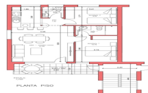
VIVIENDA MODELO "CADIZ" piso de 2 Dormitorios